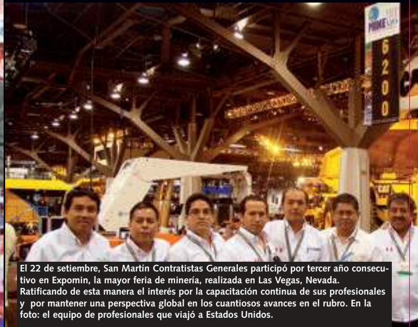
El 22 de setiembre, San Martín Contratistas Generales participó por tercer año consecutivo en Expomin, la mayor feria de minería, realizada en Las Vegas, Nevada. Ratificando de esta manera el interés por la capacitación continua de sus profesionales y por mantener una perspectiva global en los cuantiosos avances en el rubro. En la foto: el equipo de profesionales que viajó a Estados Unidos.