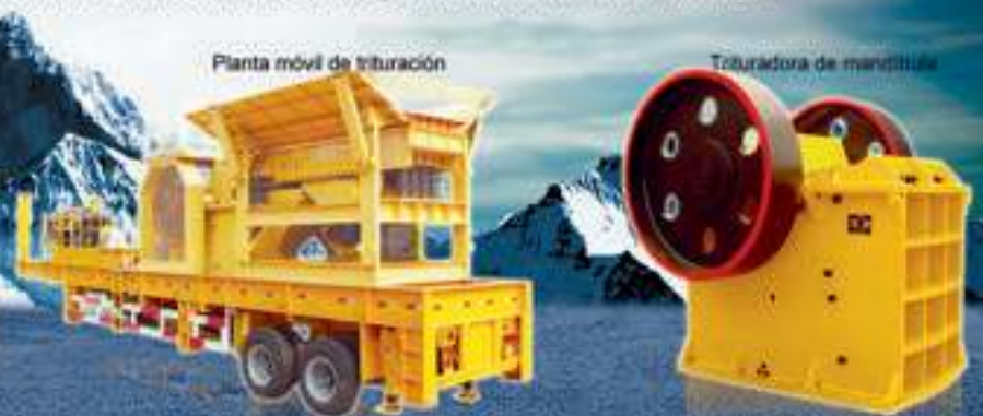
Trituradora de mandíbula