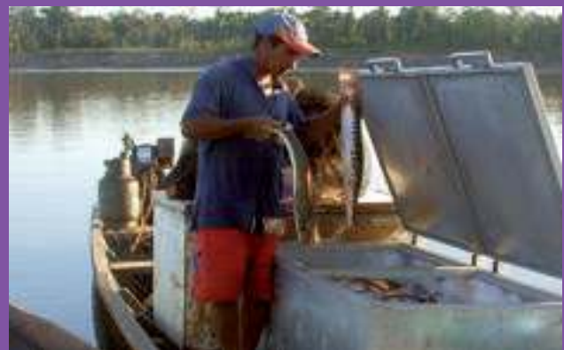
Aguaytía Energy del Perú S.R.L.

Sin duda, al contar con pescado fresco dentro de una congeladora, los pobladores de Pucallpa e Iquitos tendrán cero pérdidas y podrán obtener ingresos del orden de US$500 a US$650 al mes. ●●