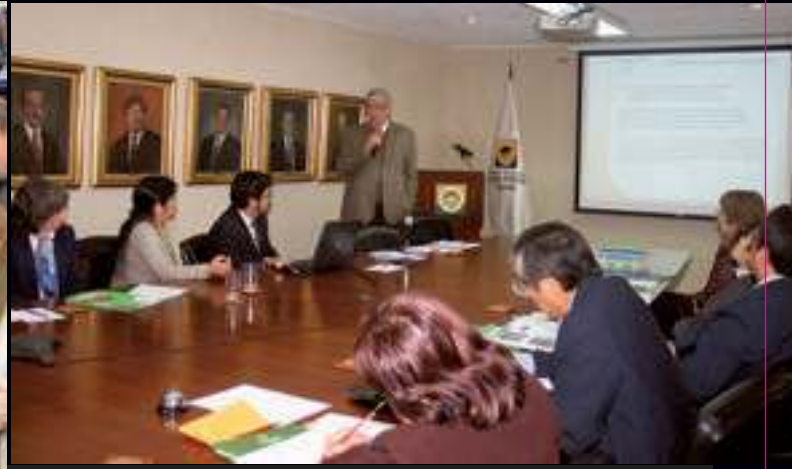
La SNMPE organizó, el 10 de octubre, la séptima edición del Foro Herramientas para el Desarrollo Sostenible. En esta oportunidad se presentó dos iniciativas de desarrollo sostenible: la Asociación Prisma mostró el "Sistema de Información para la Gestión de Programas Sociales" y luego, la Academia para el desarrollo Educativo expuso sobre "La propuesta de Aprende para escuelas docentes y multigrado".