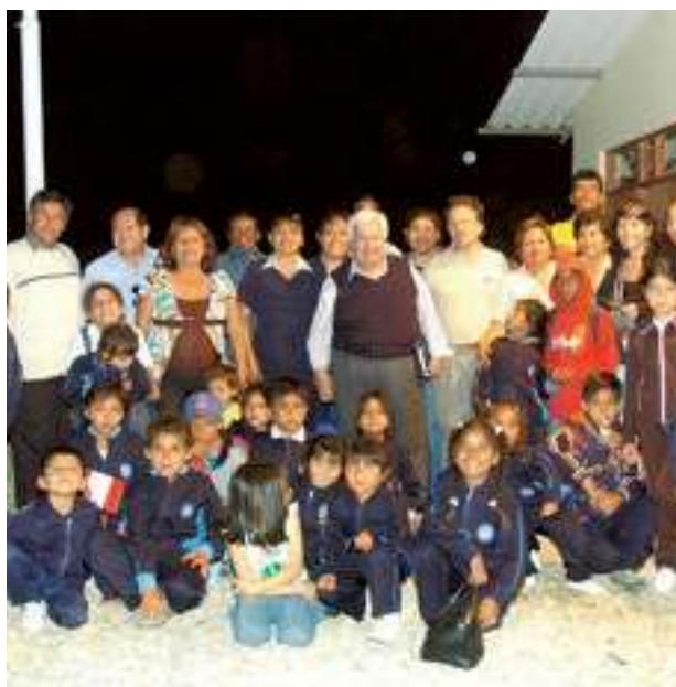
Empresa Eléctrica de Piura S.A.

Tras una primera etapa de socialización –donde se hizo un censo para conocer a las familias del caserío, además de la revisión médica y académica de todos los niños de Piedritas– empezó la construcción de la escuela primaria y zonas