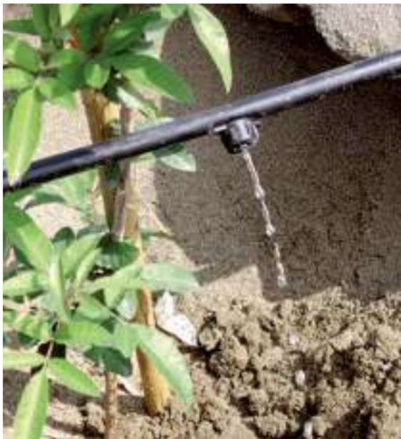
Refinería La Pampilla S.A.