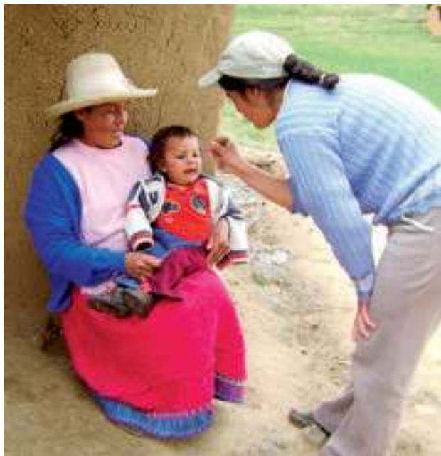
Cia. Minera Antamina S.A.

estratégicos, como la implementación de cocinas mejoradas, rellenos sanitarios, letrinas y fuentes de agua segura; la generación de ingresos capacitándose en la implementación de actividades productivas que mejoren el acceso de las familias a una alimentación balanceada. Finalmente, impulsar la conformación de comunidades y municipios saludables, logrando la elaboración de planes concertados en nutrición y salud, además del compromiso de la comunidad para su implementación.