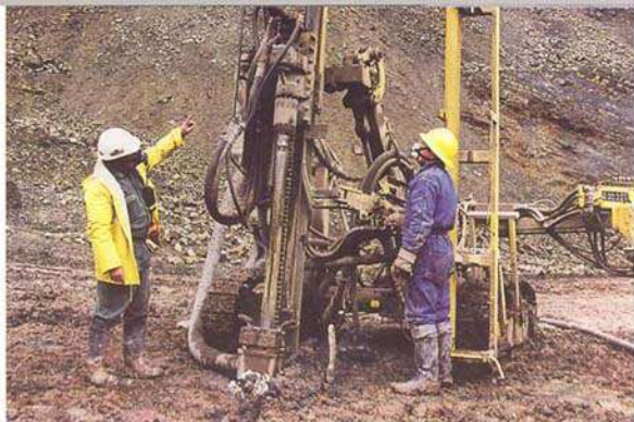
Confesía: El Bocal

esquema de funcionamiento del nuevo segmento, pues será el encargado de elaborar el reporte geológico que se requiere para participar en la Oferta Pública Primaria y el listado en el Segmento de Capital de Riesgo de la BVL.