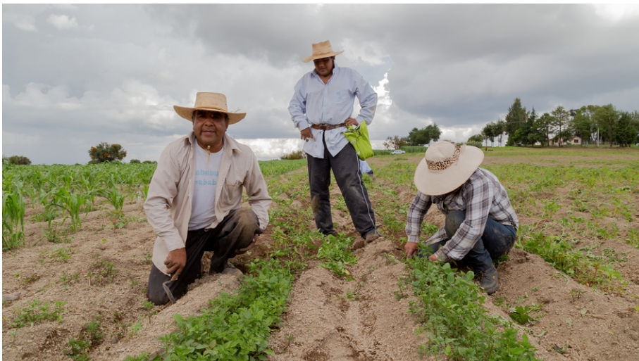
NAILOTL M. IICA