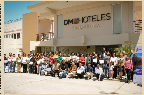
FACEBOOK INFOVOCES MOQUEGUA