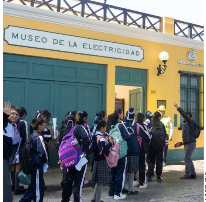
LUZ DEL SUR

Renovaron equipos, maquetas, paneles interactivos y vitrinas de exhibición. También se realizó la conservación profesional del patrimonio histórico, como los objetos personales del físico, ingeniero y matemático peruano candidato al Premio Nobel de Física en 1943, Santiago Antúnez de Mayolo, así como la colección de artefactos antiguos. Estos elementos emblemáticos, incluido el tranvía eléctrico “El Vagón del Recuerdo”, representan todo un legado para las actuales y futuras generaciones, agrega el ejecutivo.